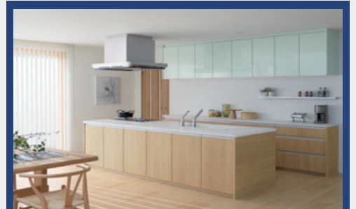
システムキッチン CRASSO