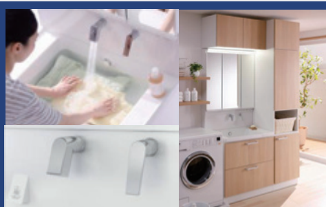
洗面台 LAVATORY DORESSER SAQUA